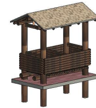
1 ISO LIXEIRA