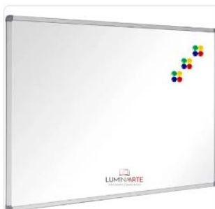
Quadro Branco de Fórmica Magnético 2,00 x 1,20 Magnético - Padrão