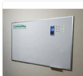
Quadro Escolar Branco Liso Magnético 200X120cm - Lousa Profissional - Moldura De ... Magnético - De chão