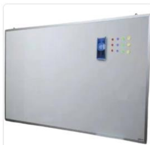
Quadro Escolar Branco Liso Magnético 200x120cm - profissional Lousatec

Lumina Arte Lousa de Vidro Entrega grátis