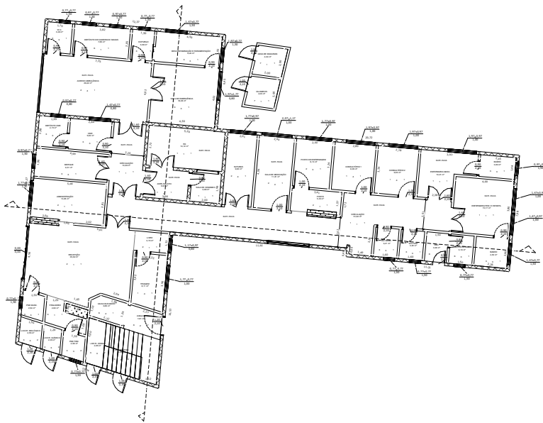
① PAV. TÉRREO 1: 100