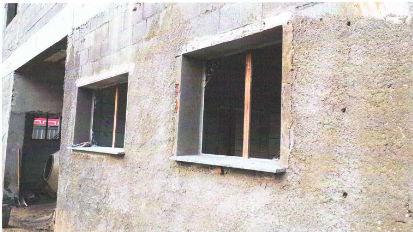
Foto 3: Assentamento de peitoril, requadro das janelas do primeiro pavimento