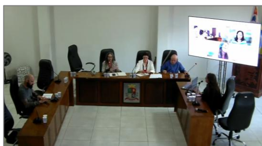
FIGURA 1 – REUNIÃO COM O CMMA – VISTA 01

Ficou definido que seria enviado para o CMMA todo o material dos produtos 4, 5 e 6 e que o conselho analisará o material para apontar sugestões e melhorias. Além disso, ficou definida a data da Audiência Pública, dia 23 de abril de 2026 às 17h30 na Casa de Cultura Nelson Gomes.